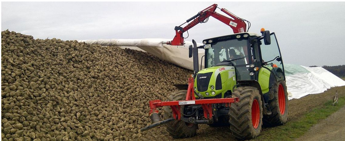
PolyTex 130-Укрытия сахарной свеклы