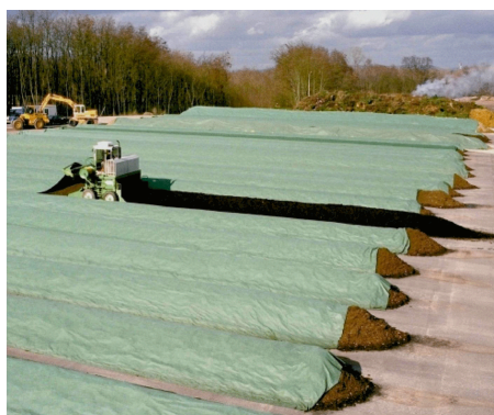
PolyTex 200- Укрытие щепы, компоста.