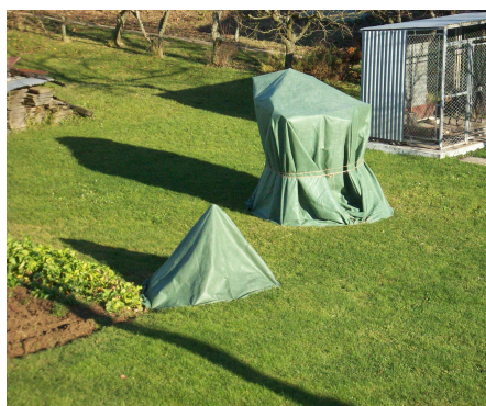
PolyTex 130-Укрытие зерновых, утепление растений.